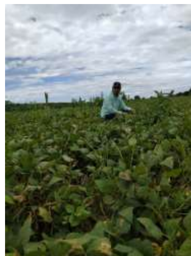
Figura 2. Acción de muestreo de conchuela de frijol ( Epilachna varivestis )